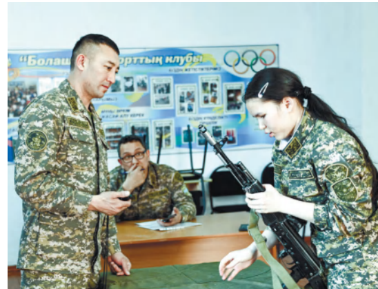
Абай өңірлік гарнизонының баспасөз қызметі

Еске салайық, «Алау» әскери-спорттық ойынының республикалық кезеңі 2025 жылдың маусым айында Қарағанды облысында өтетін болады.