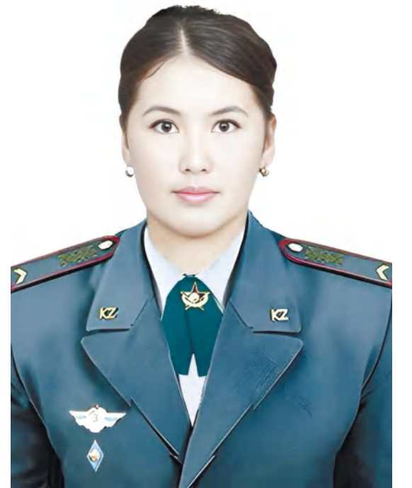
ді ер жігіттің жолын ұстанған патриот қыз. Сіздің де мерекеңіз құтты болсын, қарындасым!