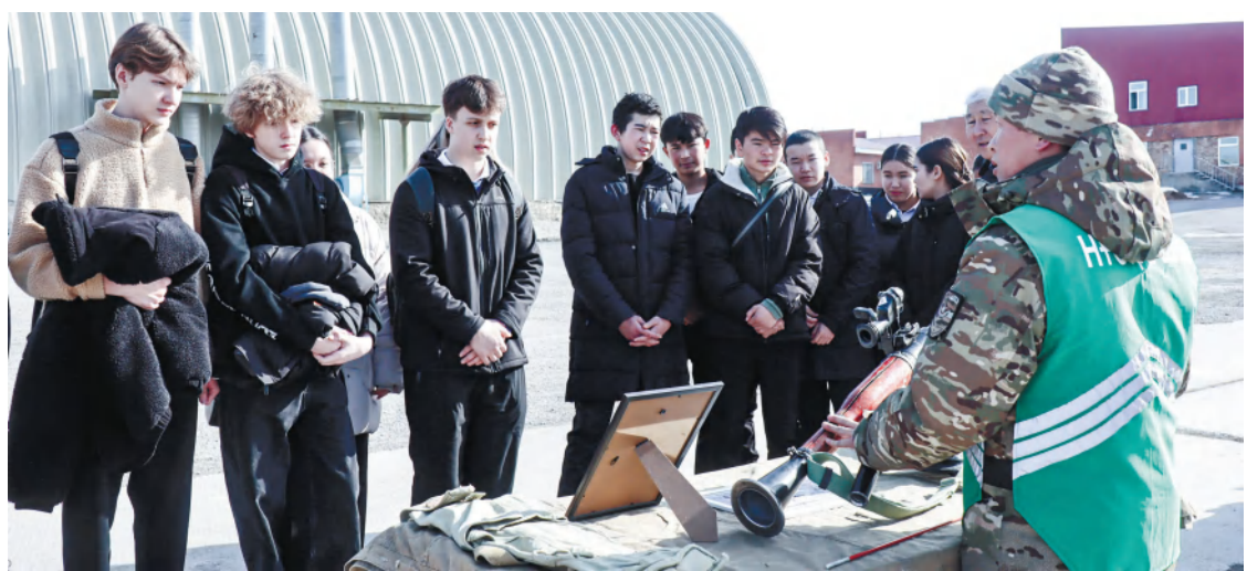
Шымкент гарнизонының баспасөз қызметі

Әскери қызметшілер оқушыларға өзіне деген сенімділік, жоғары жетістіктерге ұмтылу және жауапкершілікті өз мойнына алудан қорықпауға шақырды. Оқушылар патриоттық өлеңдер мен әндерді орындап, әскери қызметшілерге алғыстарын жеткізді.