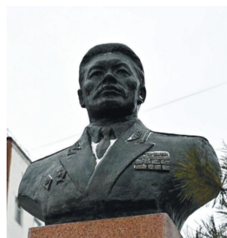
ЖАНСЕН КЕРЕЕВ – КЕҢЕС ЗАМАНЫДА ГЕНЕРАЛ-ЛЕЙТЕНАНТ АТАҒЫНА ИЕ БОЛҒАН АЛҒАШҚЫ ЖӘНЕ ЖАЛҒЫЗ КАДРЛЫҚ ҚАЗАҚ ОФИЦЕРІ.

Вокзал маңындағы алаңда Ақтөбе облысының атақты тұрғынына гүл шоқтарын қою рәсімі өтті. Оған Қарулы Күштердің, Ауған соғысының ардагерлері мен әскери басшының туыстары қатысты.