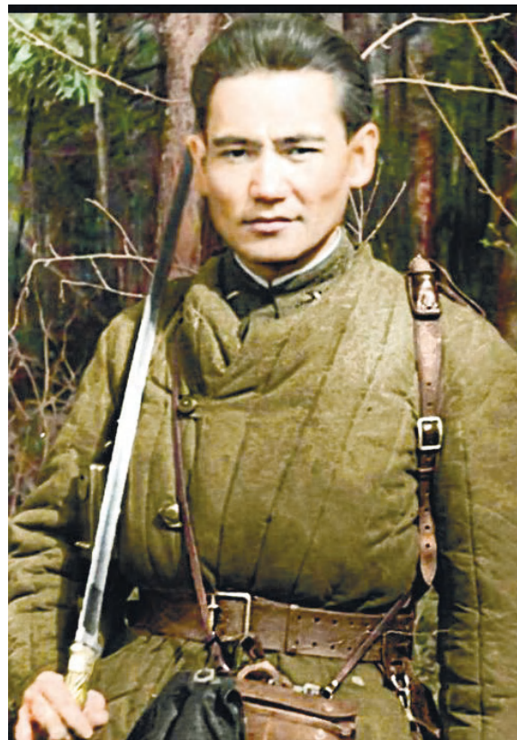
Бүгінгі күні егеменді ел болып, қазақ деген ұлт болып отыруымыздың өзі ата-бабаларымыздың ерлігінің арқасы. «Адам болу - қасиет, азамат болу - міндет, патриот болу - парыз» Бауыржан Момышұлы ағамыздың осы айтылған бір сөзі жастары отаншылдықты баулитыны анық ақпайт.

Б. Момышұлының каллиграфиялық жазуымен жазылған күнделігінің көшірмесі мен жеке құжаттарының түпнұсқасы елордамыздың төрінде орналасқан ҚР ҚҰ Ұлттық әскери-патриоттық орталығы Әскери-тарихи музейінің «XX ғасырдың әскери тарихы» залында келушілер назарына ұсынылған. Бұл күнделікті оқи отырып та, оның өмірінің жауынгерлік кезеңдерін ғана емес, сондай-ақ ел тарихын, сол күрделі кезеңнің ауқымды оқиғаларымен жақын танысуға болады.