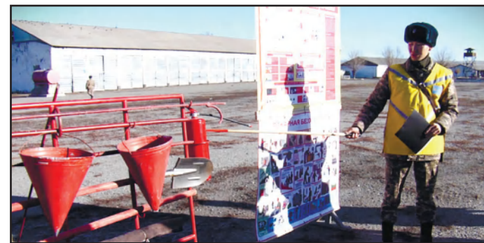
ТАЛАПТАРДЫ САҚТАУ БОЙЫНША САБАҚ