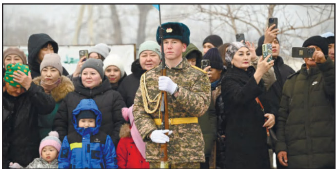
ТӘЛІМІ МОЛ ТАРИХИ СӘТ