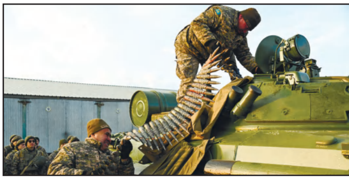
ЗАДАТЬ ТЕМП БОЕВОЙ УЧЕБЕ