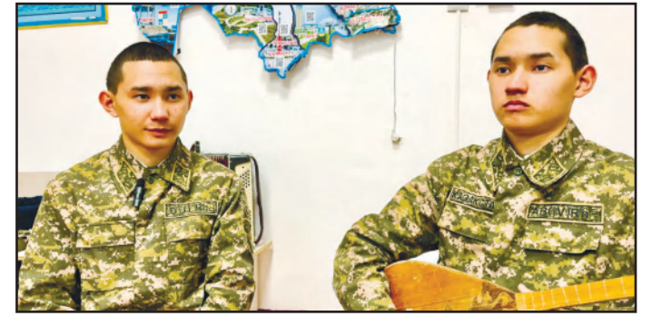
ЕЛ ӘСКЕРІНДЕГІ ЕГІЗДЕР