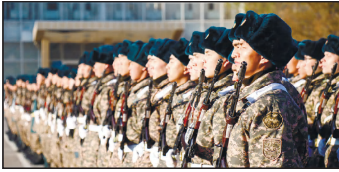
ОГРОМНАЯ ЧЕСТЬ - БЫТЬ ЧАСТЬЮ АРМИИ