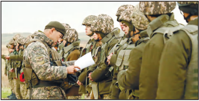
АЛҒАШҚЫ АТЫС ЖАТТЫҒУЛАРЫ