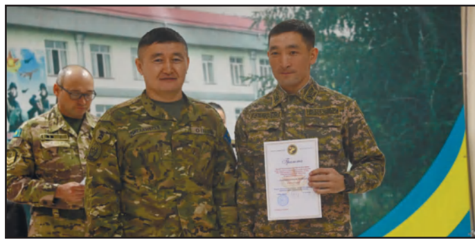
ПЛАНОМЕРНО ШЕЛ К ПОБЕДЕ