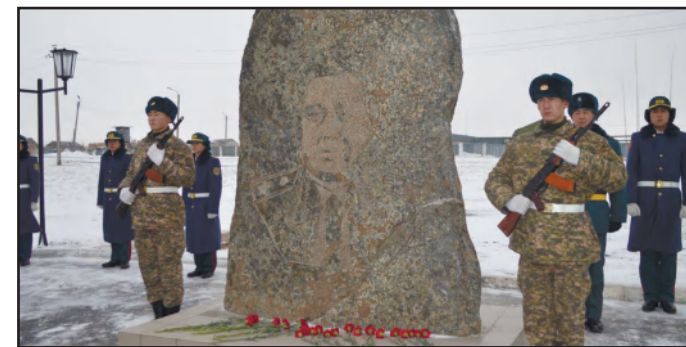
ҚАРАҒАНДЫДА БАТЫРЛАР АЛЛЕЯСЫ АШЫЛДЫ