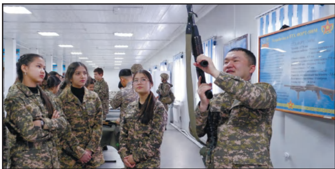
ӘСКЕРИ БӨЛІММЕН ЕТЕНЕ ТАНЫСТЫ