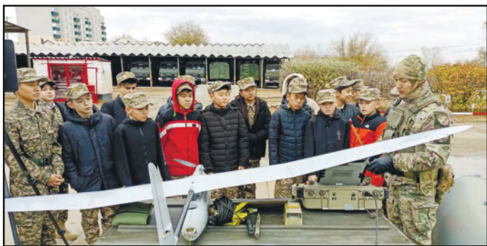
МЕРЕКЕЛІК ӘСКЕРИ-ПАТРИОТТЫҚ ШАРА