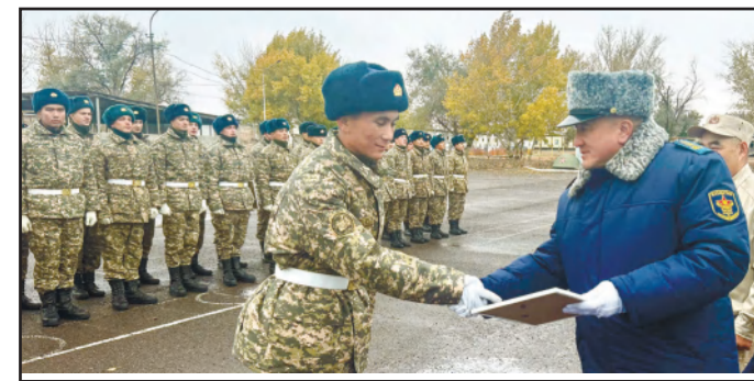
ӘСКЕРДЕ ШЫҢДАЛҒАН САРБАЗДАР