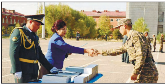
ЖАУЫНГЕРЛІК ТУМЕН ҚОШТАСУ