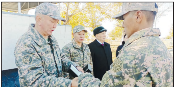
САРБАЗДАР МИНИСТРДІҢ СЫЙЛЫҒЫН АЛДЫ