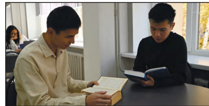
ІЗ АРМИИ - ПО ГРАНТУ В ПРЕСТИЖНЫЙ ВУЗ