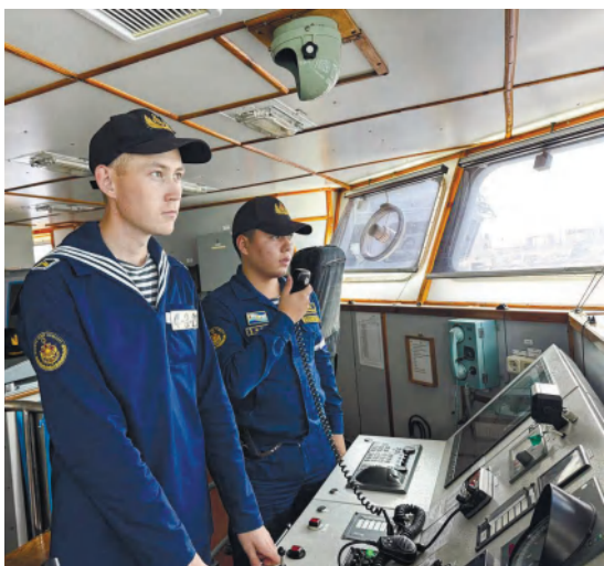
В нем задействованы ракетно-артиллерийские корабли «Мангыстау», «Сарыарка», «Орал»