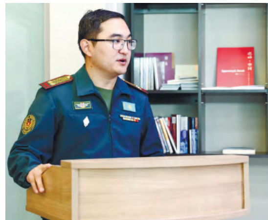
Лекции и практические занятия с ними провели ведущие преподаватели Республиканского научно-

Курсы повышения квалификации на базе Национального университета обороны и Военного института Сухопутных войск им. Сагадаты Нурмагамбетова прошли психологи Вооруженных Сил, других войск и воинских формирований.