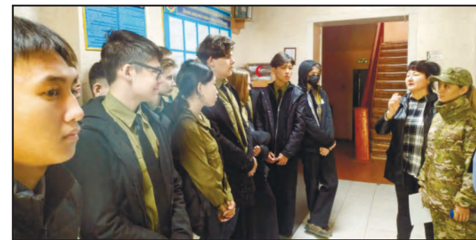
ӘСКЕРИ БӨЛІМДЕГІ ПАТРИОТТЫҚ ШАРА