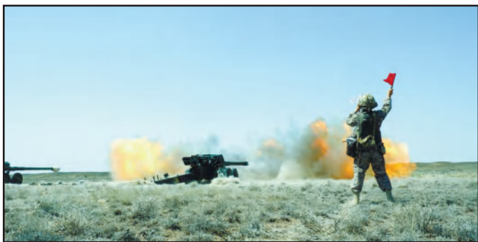
ҰРЫСТА ТӘУЕКЕЛ ЕТУ ДЕ - ЕРЛІК