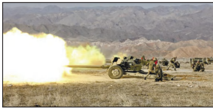
МАСТЕРА ТОЧНЫХ РАСЧЕТОВ