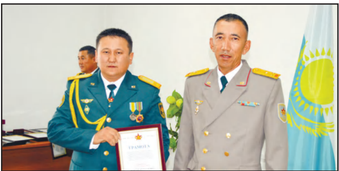
МЕМЛЕКЕТТІК ЖӘНЕ КӘСІБИ МЕРЕКЕ ҚАТАР АТАП ӨТІЛДІ 3 - бетте