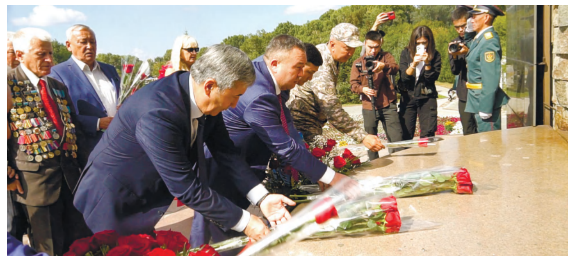
Абай өңірлік гарнизонының баспасөз қызметі

Семей полигоны осыдан 33 жыл бұрын, 1991 жылы 29 тамызда жабылды. Осылайша Қазақстан әлемде алғашқылардың бірі болып ядролық қарудан бас тартқан ел болды.