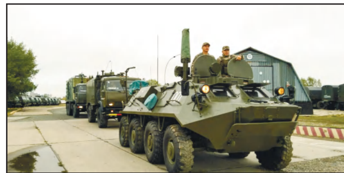
«АЙБАЛТА-2024» ОҚУ-ЖАТТЫҒУЫНА АТТАНДЫ 7 - бетте