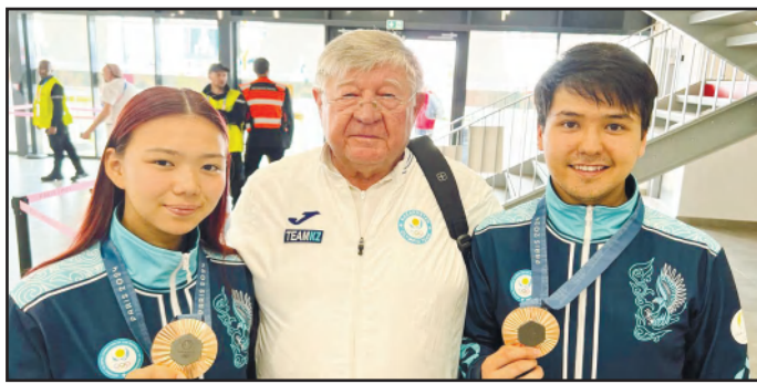
ПРЕОДОЛЕВАЯ СЕБЯ 5 - бетте