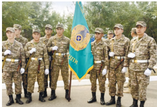
53975 әскери бөлімі Қазақстан Республикасының Конституция күніне, бөлімнің құрылғанына 82 жыл толуына орай «Ашық есік күні» мерекелік іс-шараларын

Мемлекеттік мереке – Қазақстан Республикасының Конституция күні. Негізгі Заңның қабылдануы – тәуелсіз Қазақстан тарихындағы аса маңызды оқиғаларының бірі.