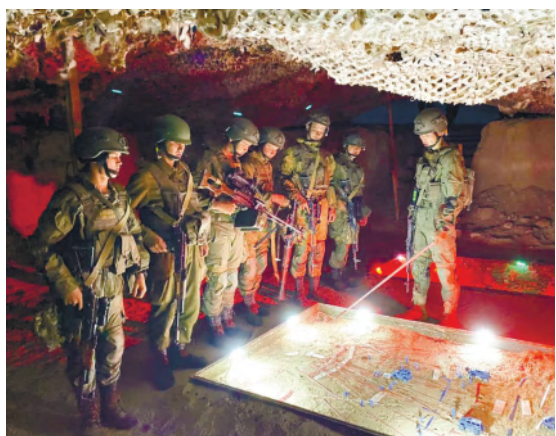
Жауынгерлік атыс сабақтары екінші десанттық шабуылдаушы батальонының жеке құрамымен

Қарулы Күштердің жауынгерлік жоспарына сәйкес, Жетісу гарнизонындағы 18404 әскери бөлімінде бөлімшелердің жауынгерлік атыс сабақтары өтті.