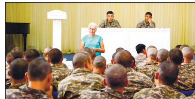
САРБАЗДАРМЕН ӨТКЕН КЕЗДЕСУ