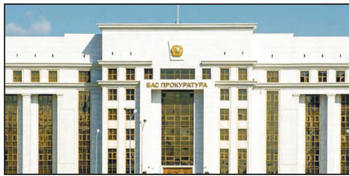
ЗАКОН И ПОРЯДОК - БАЗОВЫЙ ОРИЕНТИР