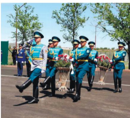
деді Қорғаныс министрі генерал-полковник Руслан Жақсылықов.

– Ұлы Отан соғысы жылдарында бес жүзден астам қазақстандық Кеңес Одағының Батыры атағына ие болды. Оның ішінде Леонид Беда, Талғат Бигелдинов, Сергей Луганский және Иван Павлов Батыр атағын екі мәрте алды. Қарулы Күштердің жеке құрамы Мемлекет басшысының ержүрек ұшқыштың есімін мәңгілік есте қалдыру туралы ұсынысын қуана қабылдады. Бүгін біз Талдықорған авиабазасына Сергей Данилович Луганскийдің есімін беріп отырмыз, -