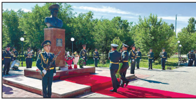
«ВСЕГДА ОСТАНЕТСЯ НАШИМ ГЛАВНЫМ ПУТЕВОДИТЕЛЕМ...» 4 - бетте