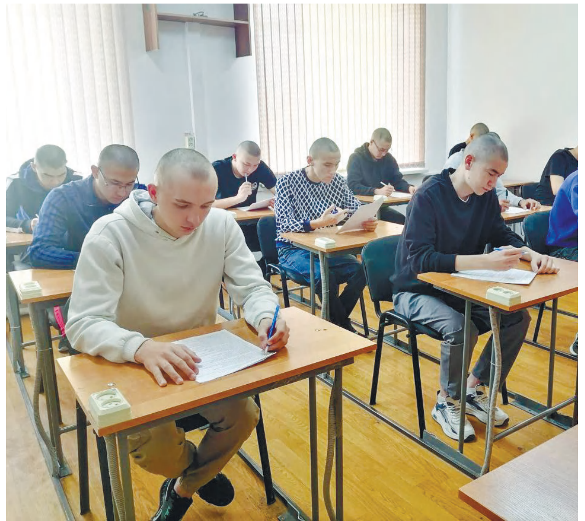
Жетісу гарнизонының баспасөз қызметі

Шарада әскерге аттанушы жастардың ата-аналары ұлдарының аман-есен Отан алдындағы борыштарын атқарып келулеріне ниет білдіріп зор ықыласпен шығарып салды.