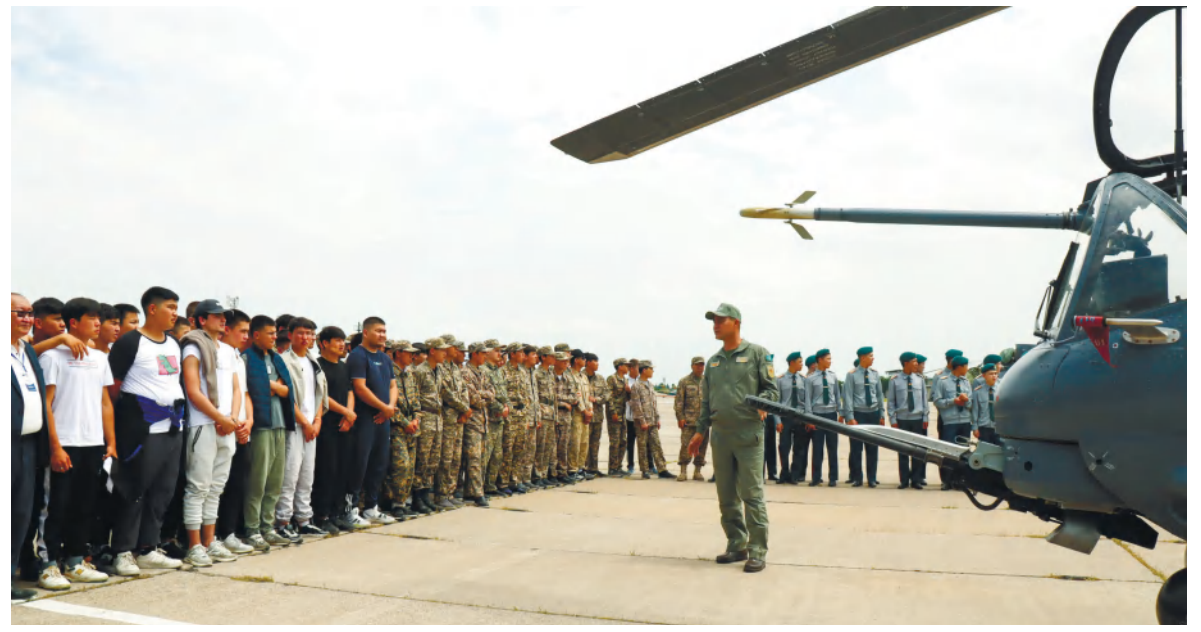
Шымкент гарнизонының баспасөз қызметі

Кездесу соңында алғашқы әскери дайындық пәнінің оқытушылары Қарулы Күштер қатарында қызмет етуге балалардың қызығушылығын тудырған пайдалы және қызықты экскурсия үшін бөлім басшылығына алғыстарын жеткізді.