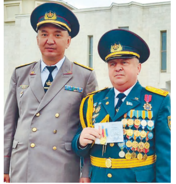
Абай өңірлік гарнизонының баспасөз қызметі

Салтанатты шара естелікке суретке түсу рәсімімен тәмамдалды.