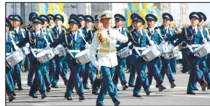
РУХТЫ ЖІГЕРЛЕНДІРЕТІН ӘСКЕРИ ОРКЕСТР 6 - бетте