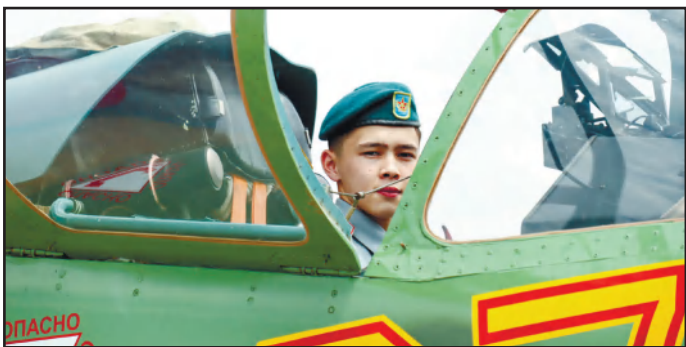
ШЫМКЕНТ АВИАБАЗАСЫ ОҚУШЫЛАРҒА ЕСІГІН АШТЫ 3 - бетте