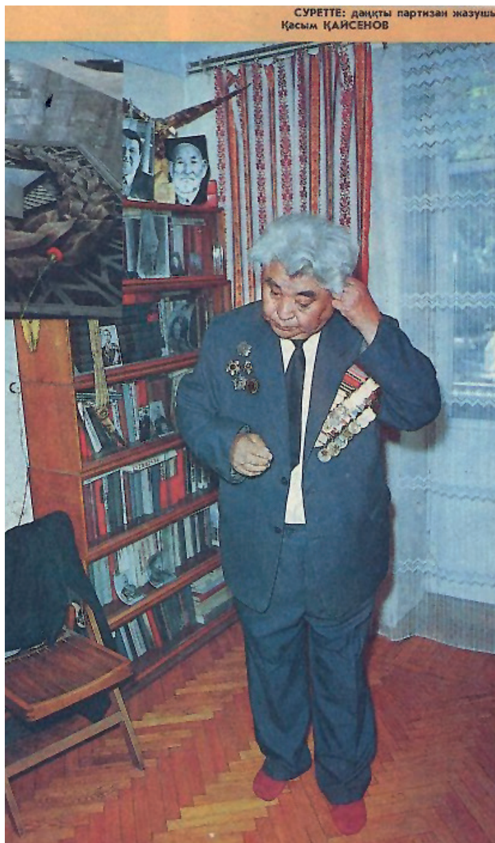
СУРЕТТЕ: даңқты партизан жазушы Қасым ҚАЙСЕНОВ

Қ.Қ.: – Жау тылына түсу дегенің – нағыз азап. Ол жаққа аттану тек түн ішінде ғана жүргізілетін. Жабық машинамен аэродромға келер едік. Сол жерде бізді «Дуглас» самолетінің ішіне кіргізіп, қарама-қарсы отыруға бұйрық беретін. Арқамыздағы парашют рюкзасына жіп өткізіп, оның ілгегін төбедегі жылжымалы роликке бекітіп қоятыны да есімде. Жасыратын несі бар, майдан шебінен өтердегі оқ шымылдығынан абыржымасын, самолет люгінен секіретінде батыл болсын дей ме екен, 200 грамнан арақ та беріп қоюшы еді. Белгілі межеге жеткенде есік ашылатын да біріміздің артымыздан біріміз 5 мың