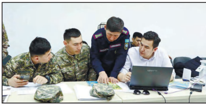
ИЗ ЦЕНТРА СОБЫТИЙ