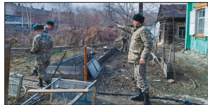
ЖАҚСЫЛЫҚ ЖАСАУ - ЖҮРЕКТИҢ ІСІ