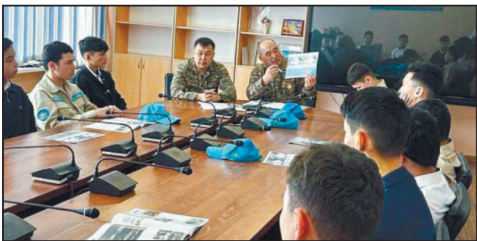
ЖАС ӨРЕНДЕРМЕН КЕЗДЕСТІ