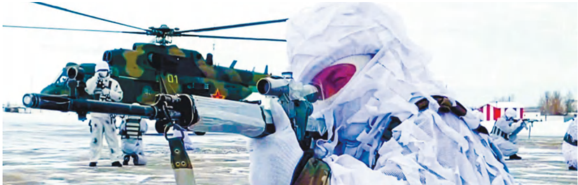
Абай өңірлік гарнизонының баспасөз қызметі

Осыдан кейін барып арнайы мақсаттағы барлау ротасы жауға тосыннан шабуыл жасау іс-әрекеттерін көрсетті. Дроннан граната лақтырып, танкіге қарсы зымыран қолданды. Осы әрекеттері арқылы жаудың автокөлік легінің жолын бөгеп, қарсылас жеке құрамының көзі жойылды. Тапсырманы орындап, құпия құжаттарды қолға түсіргеннен кейін арнайы мақсаттағы барлау тобы Ми-8 тікұшағымен эвакуацияланды. Жалпы тактикалық оқу-жаттығу жоғары деңгейде өтті.