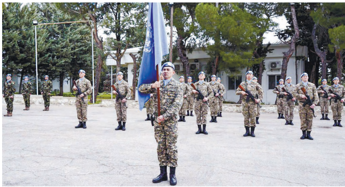
В мероприятии приняли участие глава миссии «Силы ООН по наблюдению за разъединением»

На миротворческой базе Фауар, расположенной в зоне ответственности миссии ООН на Голанских высотах, состоялась торжественная церемония передачи знамени Организации миротворческому контингенту Казахстана.