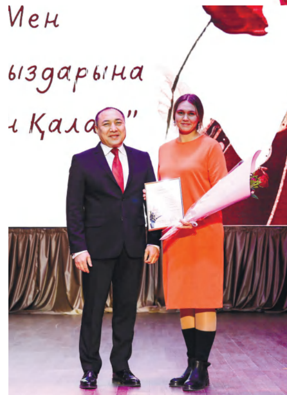
Иен ыздарына «Қала»

В этот вечер из зрительского зала и со сцены прозвучало много интересных историй и добрых пожеланий в адрес виновниц торжества. Завершилось мероприятие праздничным концертом творческих коллективов Государственной академической филармонии им. Е. Рахмадиева и силовых структур.