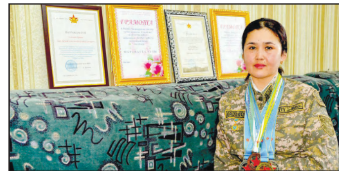
ҮЗДІКТЕРГЕ ӘРҚАШАН ОРЫН БАР