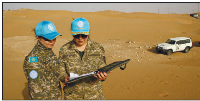
ЖЕНЩИНЫ КАК ОПОРА АРМИИ