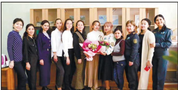
ӘЙЕЛДІҢ ЖАНЫ - НӘЗІК, ІСІ - БЕРІК