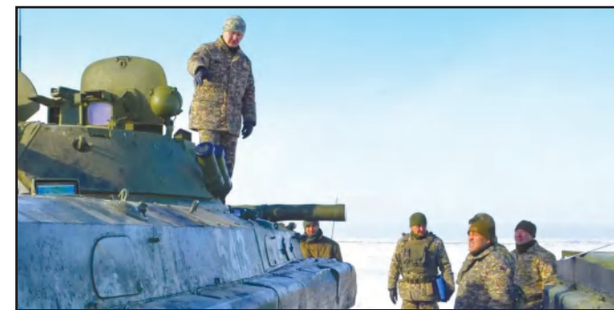
СЕРЖАНТТАР САНАТЫ ТЕКСЕРІЛДІ 5 - бетте