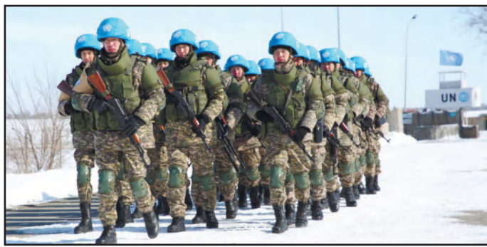
ГОТОВЫ К УБИТИЮ НА ГОЛАНСКИЕ ВЫСОТЫ 4 - бетте