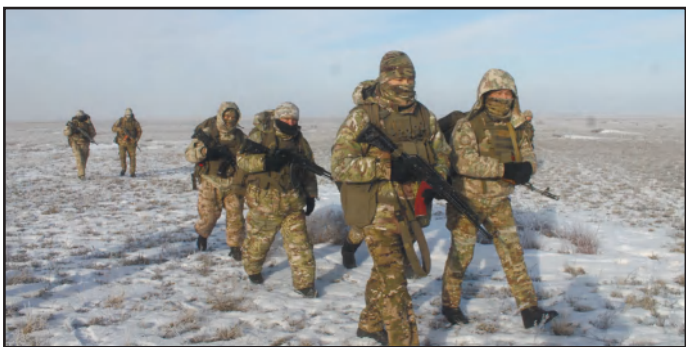
ТОПТАРДЫҢ ҰЗАҚ ҚАШЫҚТЫҚТАҒЫ ҚОЗҒАЛЫСЫ 3 - бетте