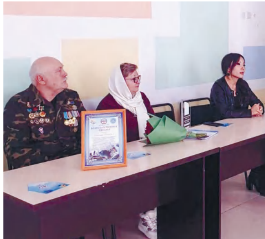
Өткен тарихты ұлықтау – бүгінгі жас буынның парызы. Осыған орай

Он жылға созылған Ауған соғысында жастық шағы мен өмірін қиған кешегі жас жауынгерлер қазіргі кезде ақыл айтар жасқа жеткен ардагерлерге айналған.