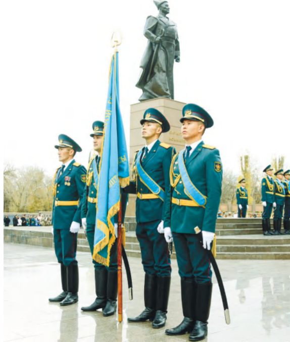
Отечества – это первая серьезная клятва молодого человека.

И аким Жамбылской области Ербол Карашукеев, и воин-афганец Халық қаһарманы генерал-лейтенант Бахытжан Ертаев, и военачальники подчеркнули, что принятие присяги – это самый важный момент в жизни каждого военнослужащего. Они подчеркнули, что с этого момента начинается настоящая военная служба солдата, и взятые им обязательства по защите