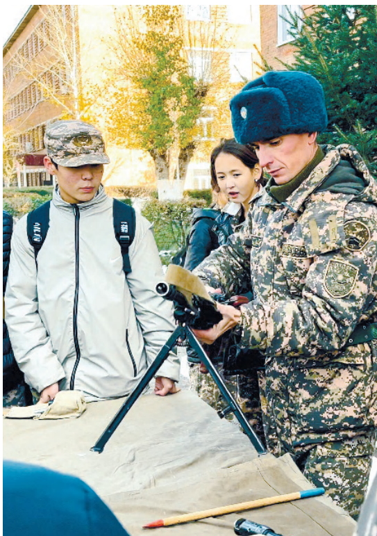
Өскемен гарнизонының баспасөз қызметі

Ағаларымызға әскерге шақырту қағазы келген кезде бойымызды бір қорқыныш сезімі билейтін, өйткені оның қайда бара жатқанын білсек те, ол