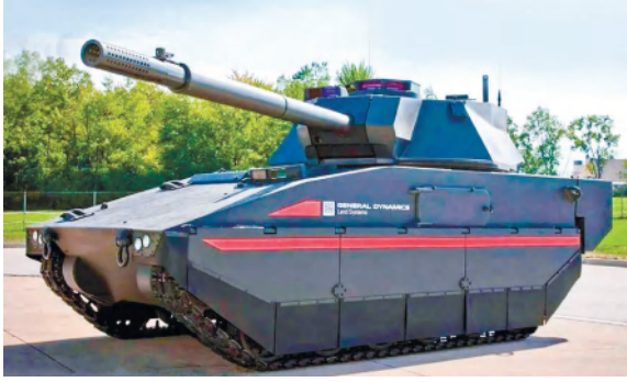
США. В 2016 году американская военно-промышленная компания General Dynamics представила легкий танк проекта Griffin массой 28 тонн. Он был

Опыт конфликтов тех лет показал, что легкобронированные бронетранспортеры и боевые машины пехоты легко выводились из строя обычным ручным противотанковым вооружением. Учитывая этот опыт, ВПК многих стран приступили к разработке собственных образцов легких танков, которые имели бы боевую мощь и защиту ОБТ, а также скорость и маневренность боевых машин пехоты.