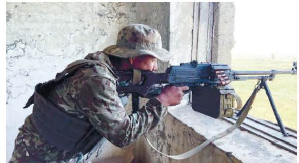
слаженности органов управления, повышение индивидуальной и групповой выучки личного состава подразделений специального назначения.

В учении задействованы боевые машины пехоты, артиллерийские и зенитные комплексы, вертолеты Ми-17, БПЛА. Мероприятие направлено на выработку методики совместного планирования специальной операции в кризисных ситуациях, совершенствование