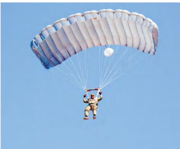
высотомерах колебались в диапазоне от 400 до 3500 метров.

Парашютные прыжки выполнялись на разных высотах. Их определяли инструкторы индивидуально, по уровню подготовки каждого специалиста. Цифры на