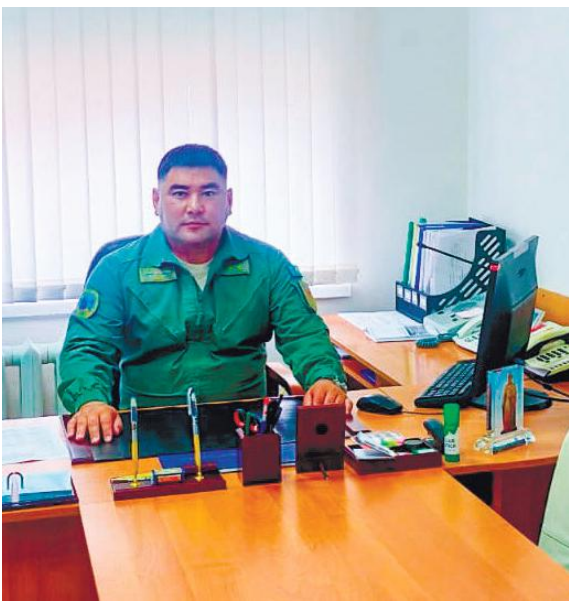
Выстроенная система командных пунктов позволяет осуществлять оперативное руководство и управление органов военного управления, воинскими частями в

Уверенное управление является залогом согласованных и успешных действий войск. От всесторонней оценки обстановки, а также своевременных и грамотных указаний зависит успех операции или боя. Свой профессиональный праздник специалисты командных пунктов и пунктов управления Вооруженных Сил отметят 15 июля.