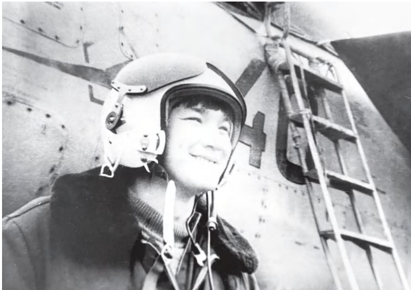
Первый самостоятельный вылет на самолете МиГ-25П. 83-й гвардейский истребительный авиационный полк ПВО. Ростов на Дону. Май, 1980 г.

Он родился 9 мая 1958 года в совхозе Минский. Думал ли простой казахский паренек, глядя в голубое небо, о том, что когда-нибудь сядет за штурвал самолета. В то время в памяти многих были еще свежие раны Великой Отечественной войны. Истинными кумирами детей тех послевоенных лет были ветераны войны, являвшие собой подлинные герои и мужество. Видя фронтовиков буквально каждый день, дети четко знали, в чем заключается смысл добытой победы, и стремились