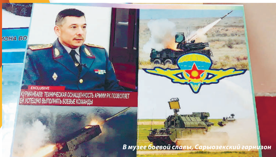
В музее боевой славы, Сарыюзекский гарнизон